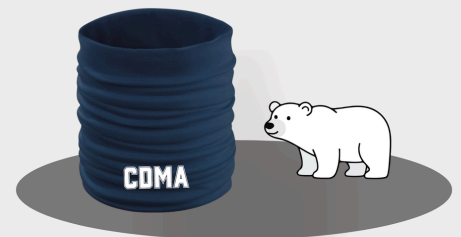
Manta Polar CDMA