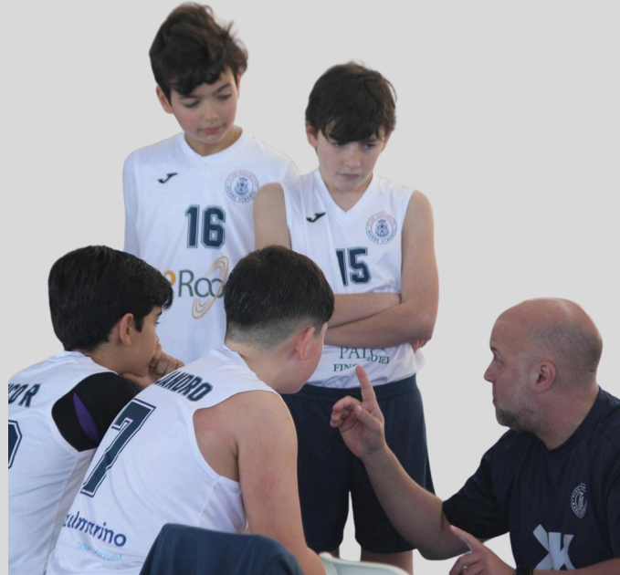
CB MADRE ALBERTA @iproom VS CALVIA